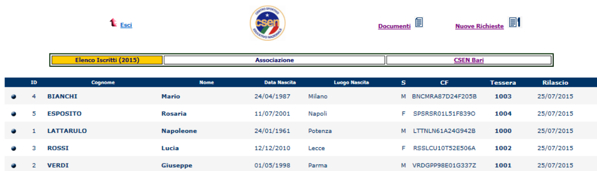
Fig. 2 – Elenco Iscritti

Attraverso l'opzione in alto a destra nuove richieste, l'operatore può passare alla fase di caricamento vero e proprio dei dati anagrafici necessari al tesseramento. Tale fase si realizza attraverso le pagine internet delle Fig. 3 e 4 seguenti.