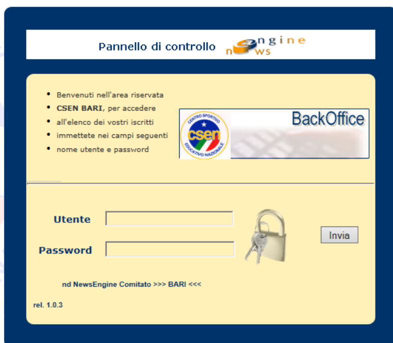
Fig. 1 – Pagina di Login

Da quest'anno sarà consentito alle associazioni sportive di effettuare le richieste di tesseramento direttamente da web accedendo ad una propria area riservata, utilizzando un normale browser tipo explorer l'operatore dovrà digitare l'indirizzo: http://www.newsengine.it/csen/kr e confermare, a questo punto comparirà la maschera video della fig. 1, per l'accesso riservato al sistema. Ad ogni associazione infatti verranno assegnate delle credenziali costituite dalla coppia codice utente e password e che precedentemente sono state comunicate attraverso una mail. Tutte le informazioni sono quindi protette e personali.